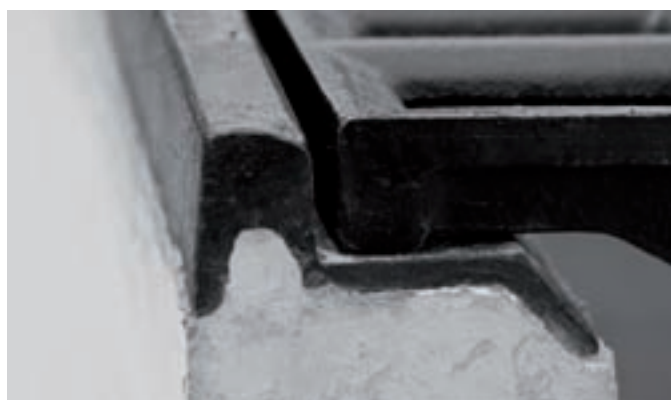
Longerons fonte scellés dans le béton Pérennité de la partie circulée