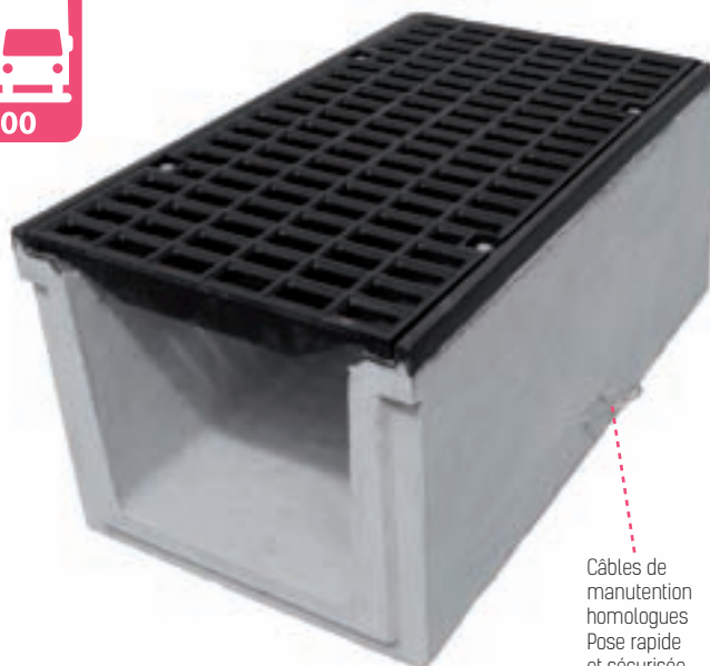
Câbles de manutention homologues Pose rapide et sécurisée