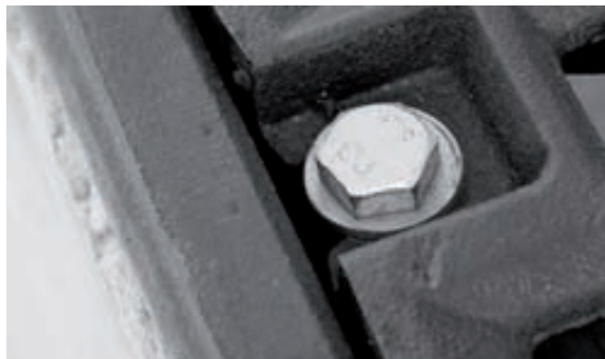
Blocage longitudinal Aucun effet de cisaillement des boutons