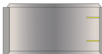
Élément H 60 cm