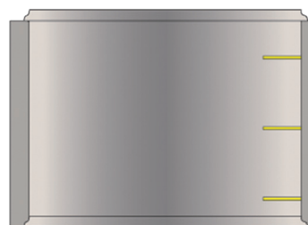
Élément H 90 cm