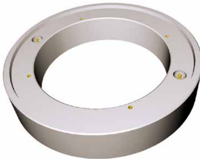
Coupe dalle répartition D980